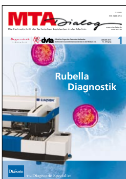
Titelbild: Rubella Diagnostik – DiaSorin Titelstory S. 20