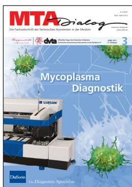
Titelbild: Mycoplasma – DiaSorin Titelstory S. 205