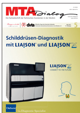
Titelbild: Schilddrüse - DiaSorin Titelstory S. 407